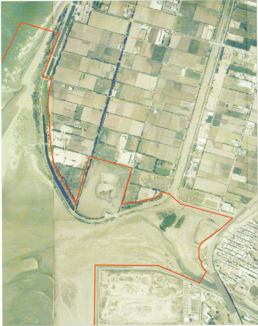
圖一之一：北界及客雅溪口